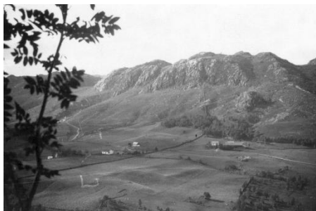
Litle Svella sett mot vest.